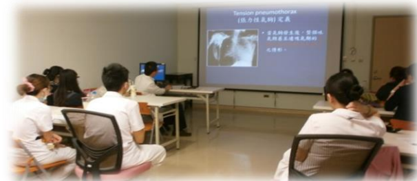
護理部各單位討論室