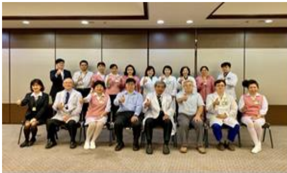
2019年通過腦中風疾病照護品質認證