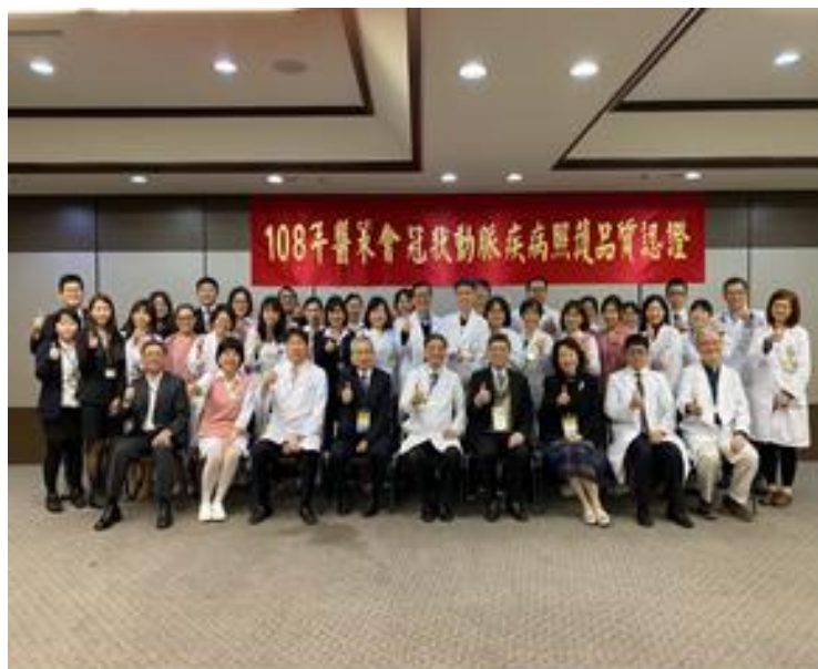
CAD全國第一家醫策會認證