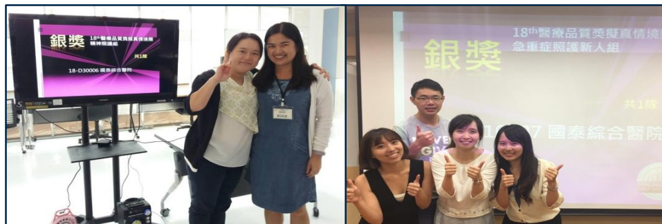
2017年第18屆醫療品質獎擬真情境類銀獎