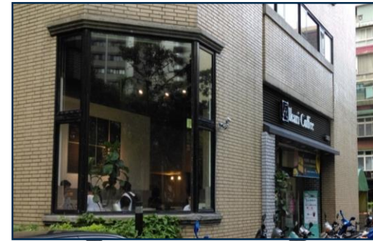
學長姊咖啡館談心

單位職前見習 到職訓練 護理臨床教師 (輔導員)制度 新進人員分享團體 人性化的管理 護理部門申訴電子信箱