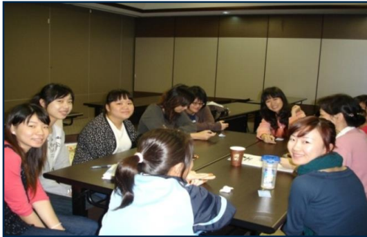
新進人員分享團體 (公時)

單位職前見習 到職訓練 護理臨床教師 (輔導員)制度 新進人員分享團體 人性化的管理 護理部門申訴電子信箱