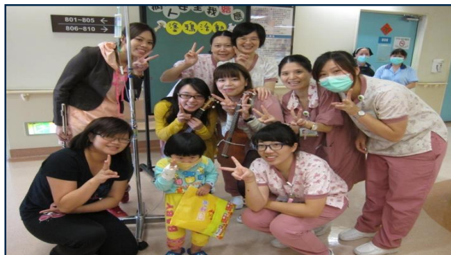
病人安全週塗鴉活動