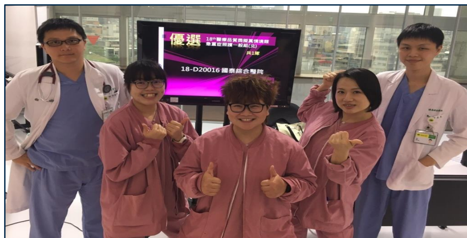
2017年第18屆醫療品質獎擬真情境類優選