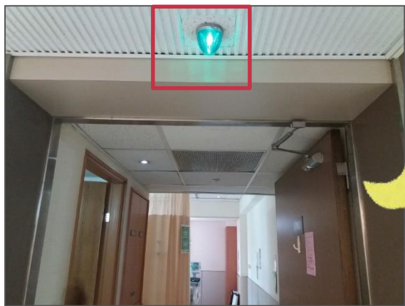
病室門口護理 人員動態燈