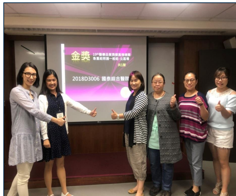
2018年第19屆醫療品質獎 擬真情境類急重組金獎