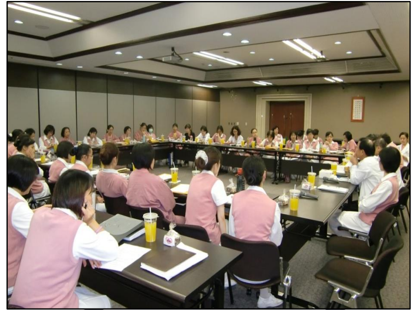
護理主管與院長有約