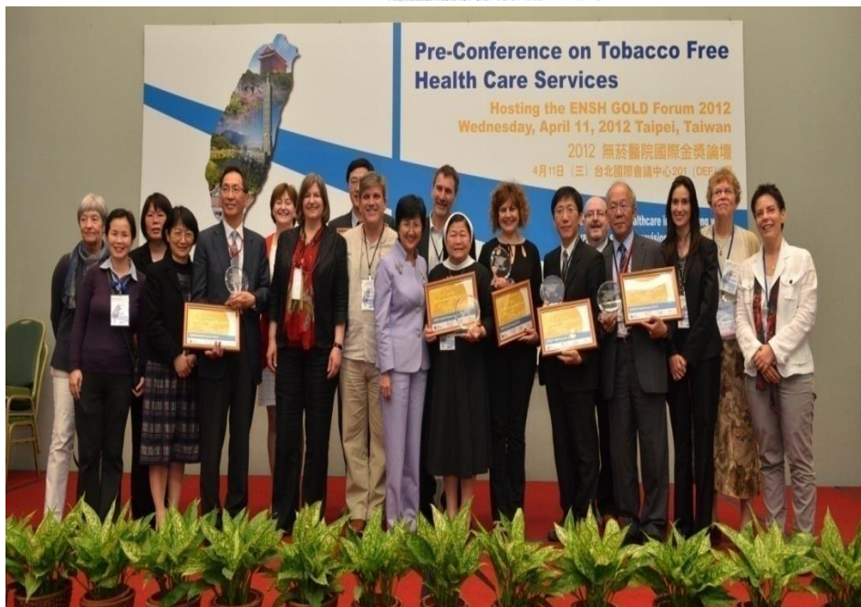
2012菸害防制團隊榮獲 無菸醫院國際金獎