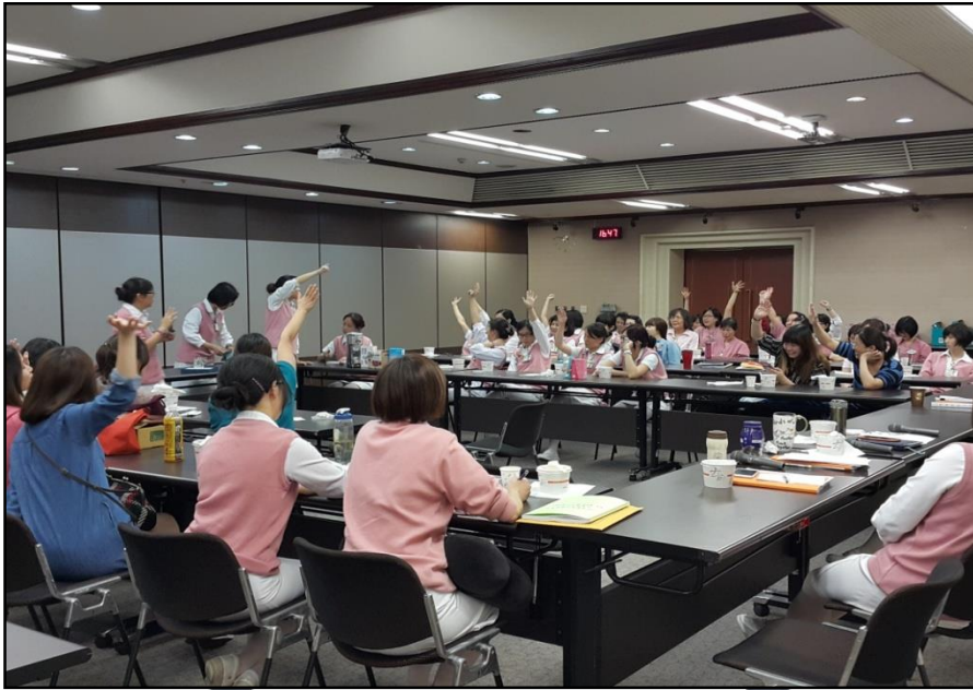
每半年護理人員大會基層人員參與