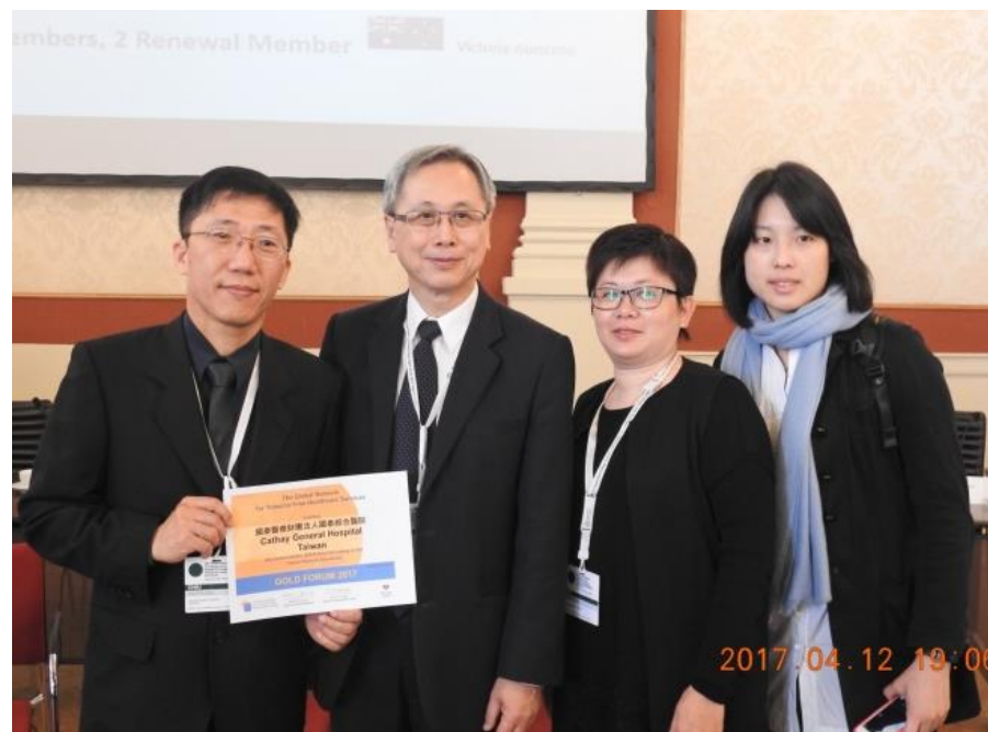
2017年再度榮獲無菸醫院國際金獎